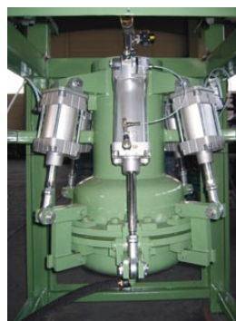
Option : Station de séchage des boues

Outre les diatomites, des perlites, fibres de cellulose et produits à base de carbone sont utilisées comme adjuvants de filtration. Nous recommandons l'emploi de l'adjuvant de filtration spécifique approprié pour chaque application. Une surface de filtration de 500-1000 g/m 2 est nécessaire en fonction du type d'adjuvant de filtration utilisé. Divers adjuvants de filtration peuvent être sédimentés dans des cas particuliers.