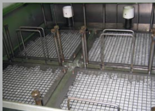
Vue détaillée : panier de filtration

Le système LFOS capte les molécules d'huile à travers un média coalescent. Les anneaux de coalescence se trouvent dans le panier de filtration et présentent une durabilité quasi illimitée. Ces anneaux peuvent être lavés en cas d'encrassement prononcé.