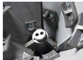
Compartiment de broyage avec arbre de broyage

La rotation de la tête de broyage assure le déchiquetage des copeaux en petits morceaux. Les copeaux sont progressivement dirigés vers le bas à travers le compartiment de broyage. Dans la partie inférieure du compartiment de broyage a lieu le broyage définitif. Après le broyage, les copeaux glissent vers l'extérieur via une goulotte située dans le montant du broyeur. Il est important que la trémie du broyeur soit toujours pleine, faute de quoi des copeaux longs pourraient parvenir entre les outils de broyage.